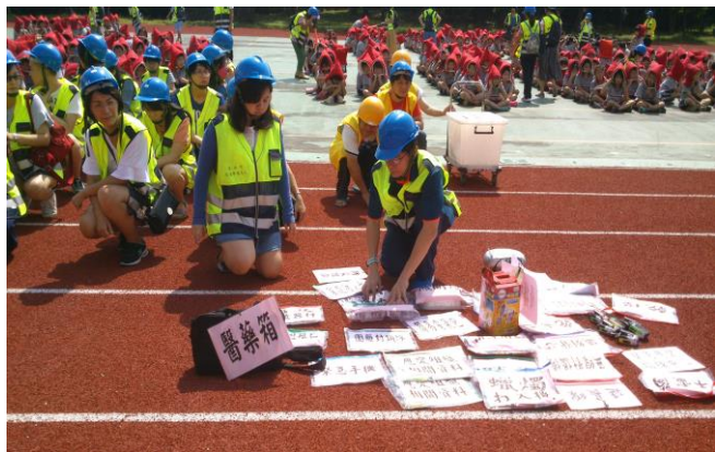
疏散現場進行職務與物品分配