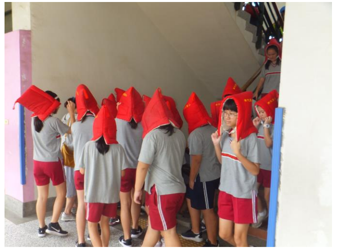
戴好防災頭套進行樓層疏散