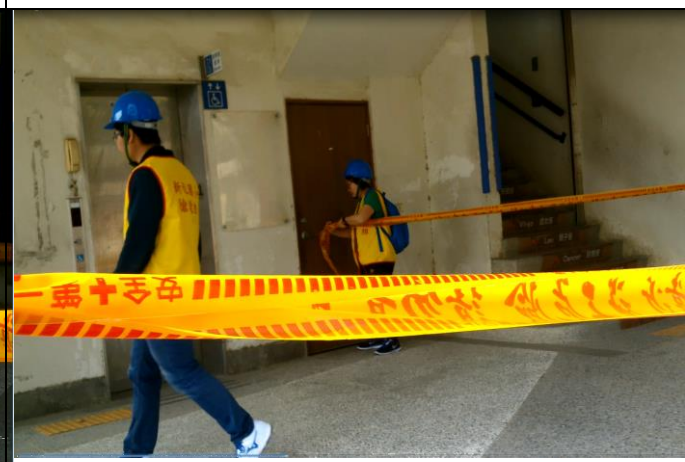
檢視火災現場是否還有未疏散人員