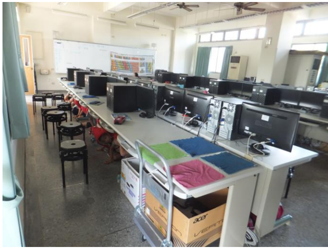
資訊教室進行趴掩穩演練