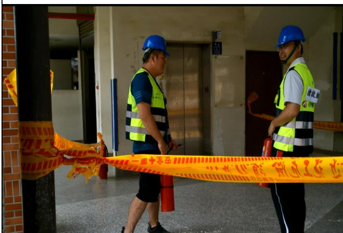
使用滅火器進行撲滅動作