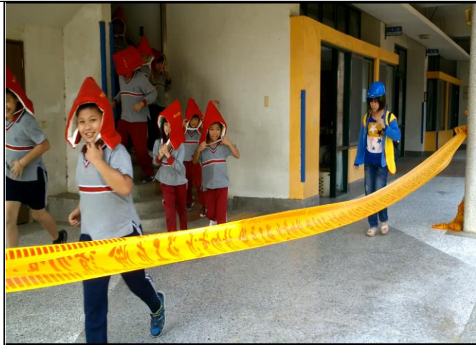
火災模擬現場拉起封鎖線